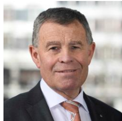
Fabrice Zumbrunnen Präsident der Generaldirektion Migros-Genossenschafts-Bund